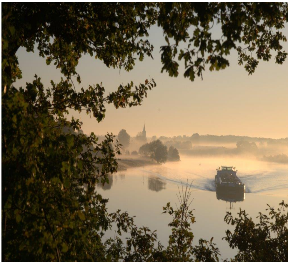
Landschap uitzicht op de Maas van Bert Jacobs