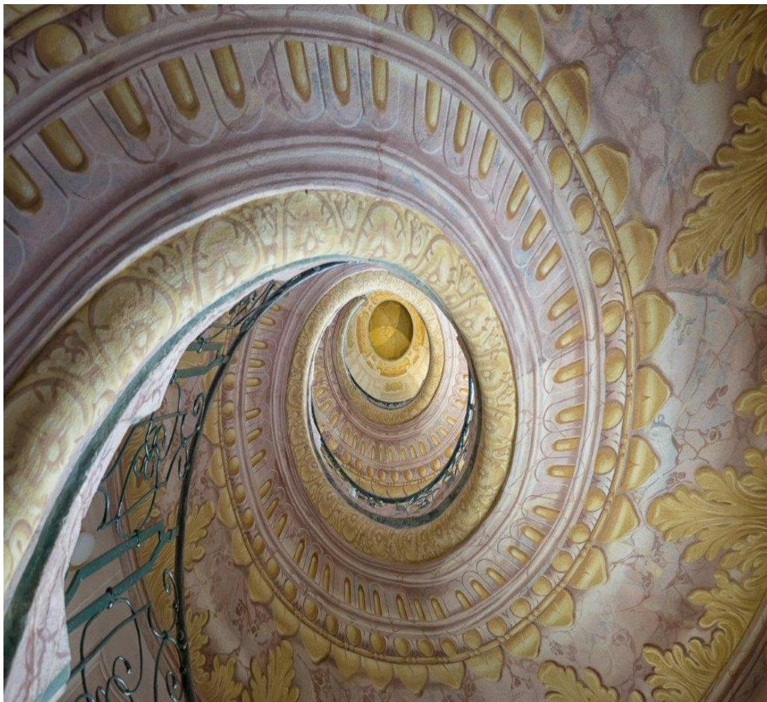
Achitectuur spiraal van Jan Thijssen